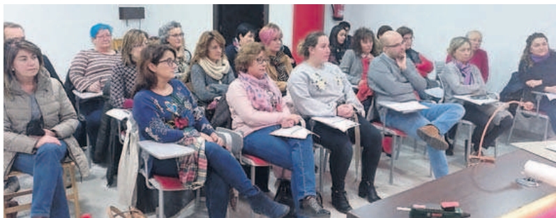
REPRODUCCIÓN D. A.

Otra de las ganaderías más afectadas por los ataques este año está siendo la de Pichicas en Forniellas, con 7 bajas.