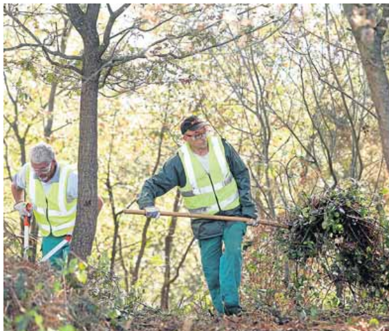
Dos trabajadores del plan de empleo en el Naranco.

El concejal de Economía, Rubén Rosón, reconoció la cifra e instó ayer al Principado «a cumplir su compromiso de hacer más de un año y compensar a los ayuntamientos afectados» por los fallos en la convocato-