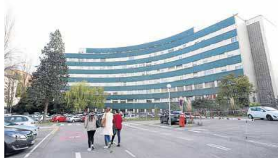
Edificio de Maternidad, vacío tras el traslado a La Cadellada.

La formación también reclama la inclusión de una partida de 150.000 euros para que se ponga en marcha la pasarela entre las estaciones de tren y autobús. Además de «incrementar la insuficiente cantidad destinada a la instalación de hierba ar-