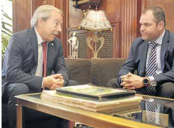
El alcalde y el presidente de la Cámara en una reunión en mayo.