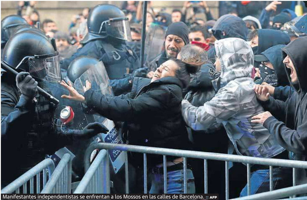
Manifestantes independentistas se enfrentan a los Mossos en las calles de Barcelona.

ESTA TARDE, EN SU PUNTO DE VENTA, EDICIÓN ESPECIAL CON LA LISTA COMPLETA DE LA LOTERÍA. EL SORTEO EN DIRECTO, EN ELCOMERCIO.ES