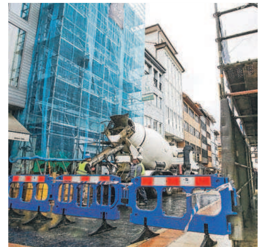
Varios trabajadores, en una obra del Antiguo.

Llama la atención que, pese al buen resultado general de los servicios en la ciudad, el número de